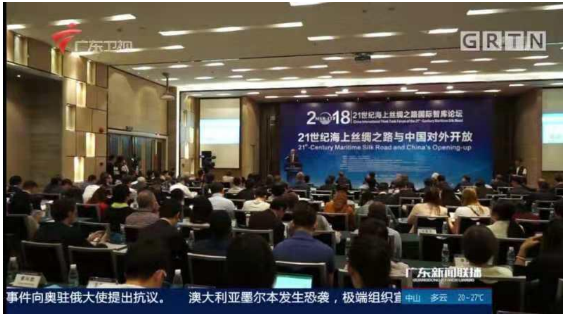
(图为广东卫视的报道)