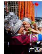
数千人身着节日开展民俗巡游等前来体验。