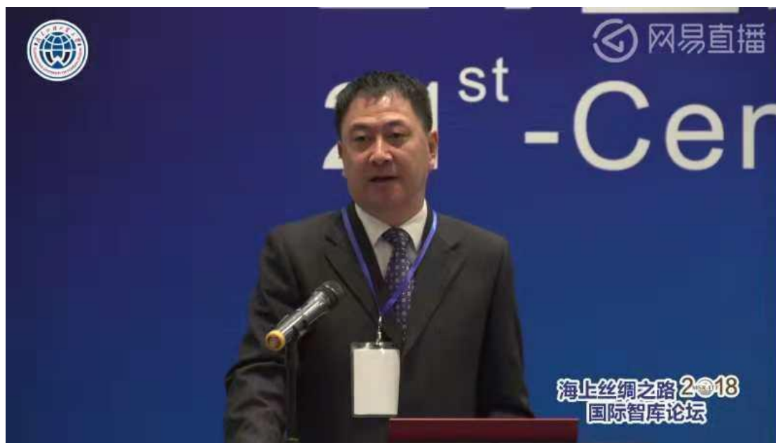
(图为我校党委书记隋广军)