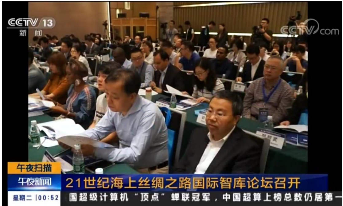
(图为专家认真听演讲)