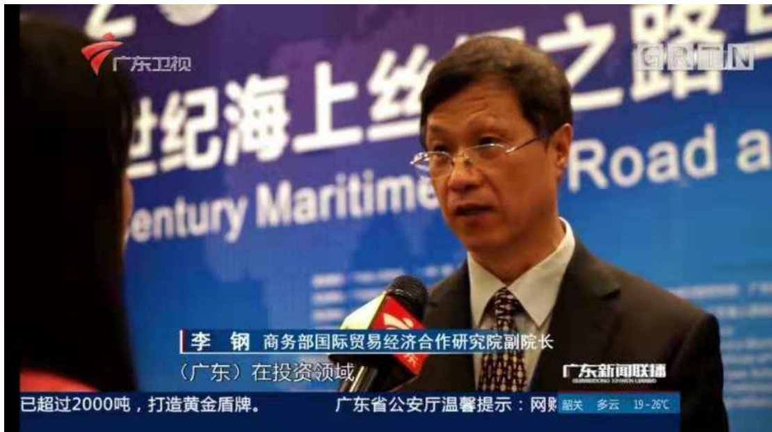
(图为广东卫视的报道)