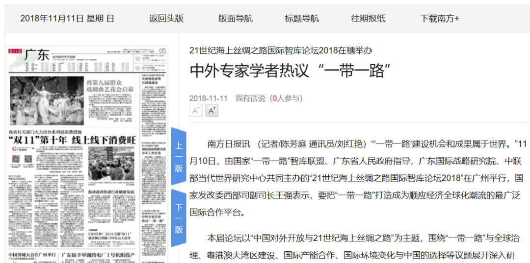
(图为南方日报的报道)