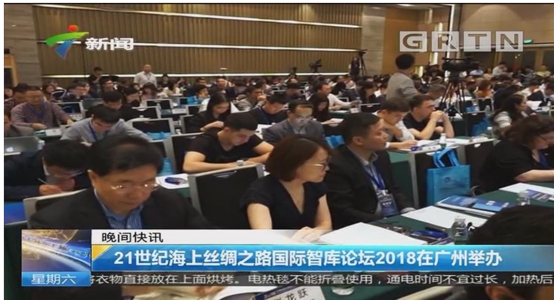
(图为珠江频道的报道)